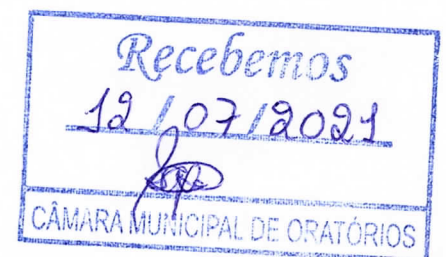
Carlos José de Oliveira Prefeito de Oratórios